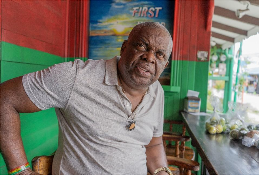
8 -- Edwin Patterson, Ex Diputado de la República de Costa Rica, activista en los derechos de los Afrodescendientes en Costa Rica y comerciante