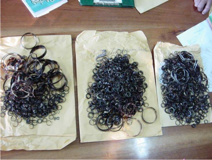
6 -Pulseras hechas con el caparazón de tortugas Carey, Bocas del Toro.