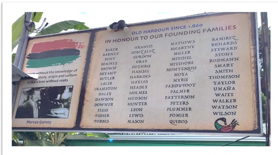
Primeros apellidos "Afrodescendientes", en radicarse en la costa costarricense. Mural ubicado en Cahuita, Costa Rica.

En Puerto Viejo Costa Rica, la familia Patterson tiene como exhibición un letrero que menciona los apellidos fundadores de esa comunidad, pues fueron, según registros las primeras familias en esa región.