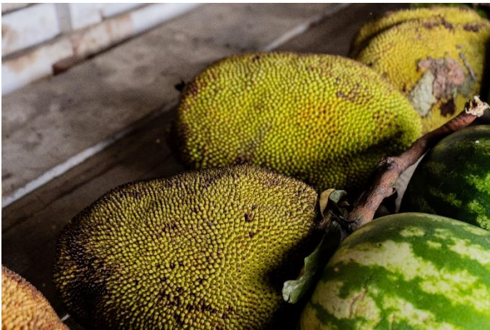
7- Jack Fruit