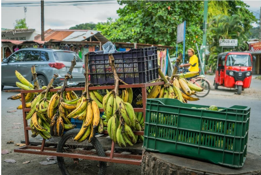
4 - Racimo de platanos – Puerto Viejo, Costa