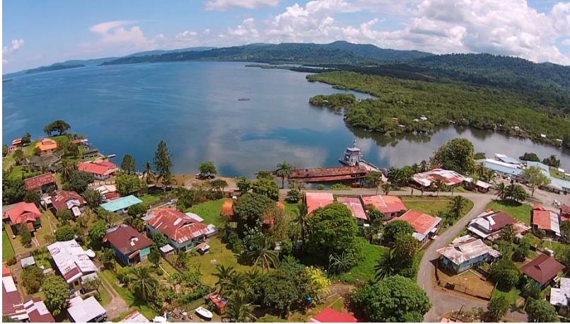
1 - Distrito de Almirante, Bocas del Toro.